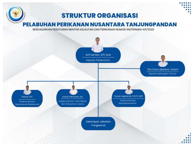
Gambar 2. Struktur Organisasi Pelabuhan Perikanan Nusantara Tanjungpandan

Berikut adalah struktur organisasi Pelabuhan Perikanan Nusantara Tanjungpandan: