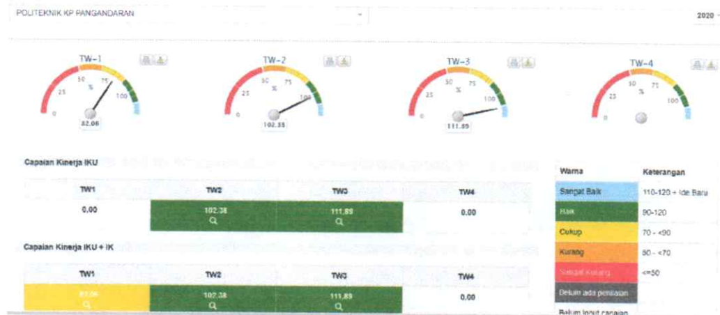
Gambar 4. Dashboard Kinerjaku Level 3 Politeknik KP Pangandaran

Pengukuran capaian kinerja Politeknik Kelautan dan Perikanan Pangandaran Triwulan III tahun 2020 dilakukan dengan cara membandingkan antara target (rencana) dan realisasi indikator kinerja utama (key performance indicator, disingkat KPI) pada masing-masing perspektif. Pencatatan dan pengukuran kinerja dilakukan dengan bantuan perangkat lunak berbasis balanced scorecard dari Kementerian Kelautan Perikanan, yaitu pada http://kinerjaku.kkp.go.id . Dari hasil pengukuran kinerja tersebut, diperoleh data capaian kinerja Politeknik KP Pangandaran di tingkat korporat triwulan III tahun 2020 sebesar 111,89%, sebagaimana dashboard kinerjaku sebagai berikut: