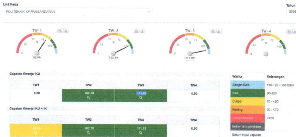
Gambar 3.1. Capaian Kinerja Perspektif Politeknik KP Pangandaran Triwulan III Tahun 2020

Pengukuran capaian kinerja Politeknik KP Pangandaran Triwulan III tahun 2020 dilakukan dengan cara membandingkan antara target (rencana) dan realisasi indikator kinerja utama (key performance indicator, disingkat KPI) pada masing-masing perspektif. Pencatatan dan pengukuran kinerja dilakukan dengan bantuan perangkat lunak berbasis balanced scorecard dari Kementerian Kelautan Perikanan, yaitu pada http://kinerjaku.kkp.go.id . Dari hasil pengukuran kinerja tersebut, diperoleh data capaian kinerja Politeknik KP Pangandaran di tingkat korporat Triwulan III tahun 2020 sebesar 111,89 % , sebagaimana dashboard kinerjaku sebagai berikut: