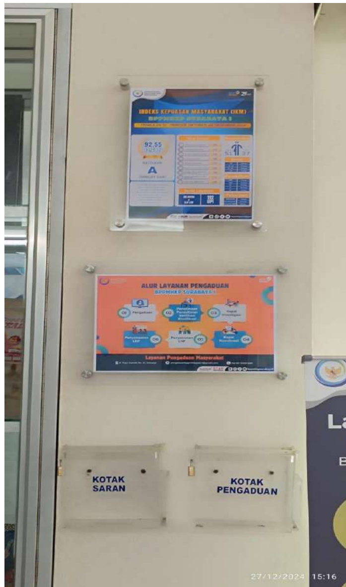
Gambar 2. Dokumentasi Hasil SKM di Ruang Pelayanan