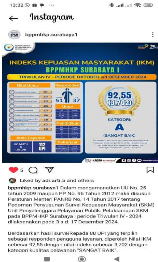
Gambar 3. Dokumentasi Hasil SKM di Media Sosial