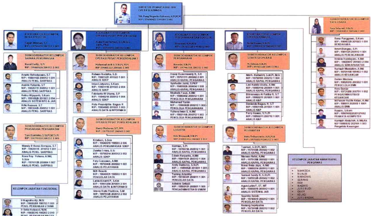
Gambar 1. Struktur Organisasi Direktorat Pemantauan dan Operasi Armada