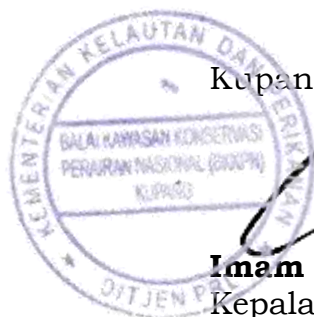
Imam Fauzi Kepala BKKPN Kupang