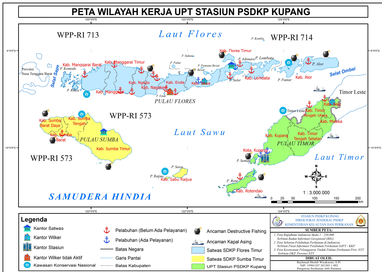
Gambar 2. Peta Wilayah Kerja dan Sebaran Satwas lingkup Stasiun PSDKP Kupang

Dalam melaksanakan operasional pengawasan sumber daya kelautan dan perikanan di wilayah kerja Stasiun PSDKP Kupang membawahi 2 Satuan Pengawasan (Satwas). Satuan Pengawasan PSDKP tersebut dapat dilihat pada tabel berikut: