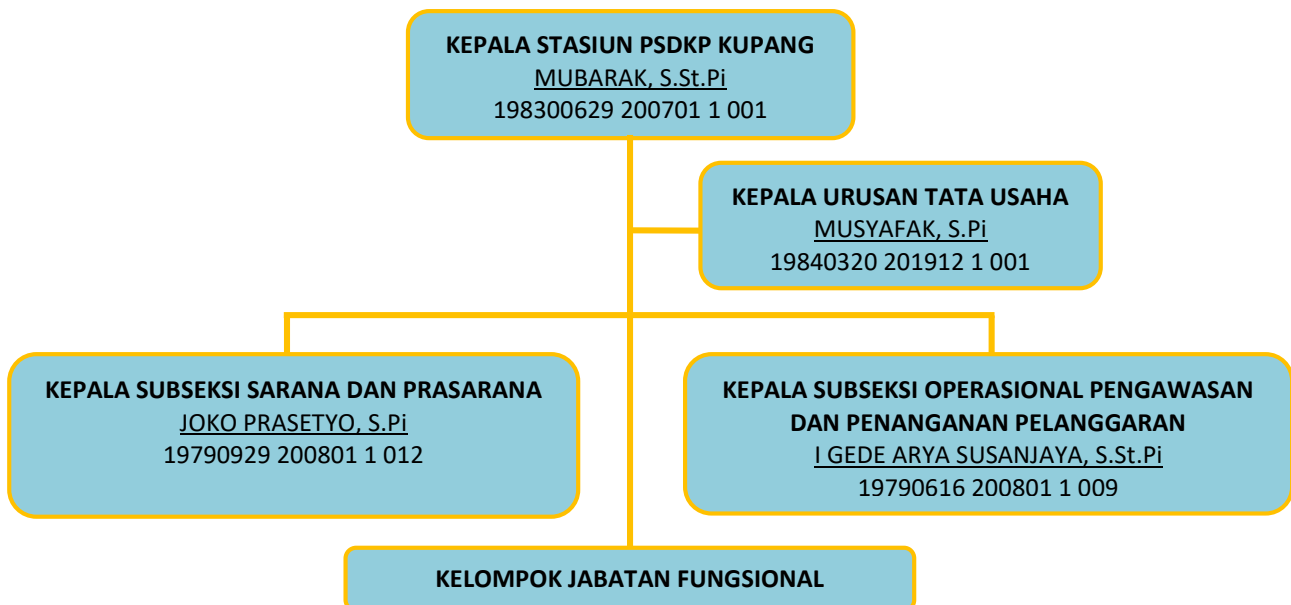
Gambar 4. Struktur Organisasi Stasiun PSDKP Kupang

Berdasarkan Peraturan Menteri Kelautan dan Perikanan Nomor 33/PERMEN-KP/2016 tentang Organisasi dan Tata Kerja Unit Pelaksana Teknis Pengawasan Sumber Daya Kelautan dan Perikanan, struktur organisasi Stasiun PSDKP Kupang disajikan dalam Gambar 4.