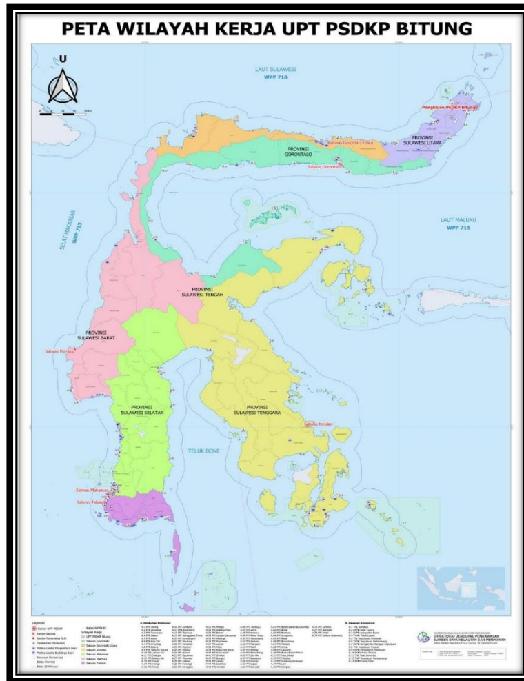
Gambar 2. Wilayah Kerja Pangkalan PSDKP Bitung

Berdasarkan SK Direktur Jenderal Pengawasan Sumber Daya Kelautan dan Perikanan Nomor 26 Tahun 2017 tanggal 7 April 2017, untuk mendukung terlaksananya kegiatan pengawasan SDKP secara efektif, Pangkalan Pengawasan SDKP Bitung dibantu oleh 6 Satuan Pengawasan SDKP 31 Wilayah Kerja PSDKP, dengan rincian :