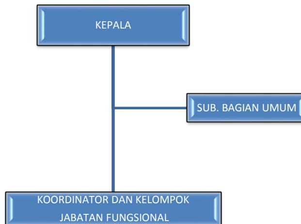
Gambar 1. Struktur Organisasi Pangkalan PSDKP Bitung

Kepala Pangkalan menyampaikan laporan kepada Direktur Jenderal Pengawasan Sumber Daya Kelautan dan Perikanan mengenai hasil pelaksanaan pengawasan sumber daya kelautan dan perikanan secara berkala atau sewaktu-waktu sesuai kebutuhan, dan dalam melaksanakan tugasnya harus menerapkan prinsip koordinasi, integrasi, dan sinkronisasi baik dalam lingkup UPT PSDKP maupun dalam hubungan antar instansi pemerintah baik pusat maupun daerah.