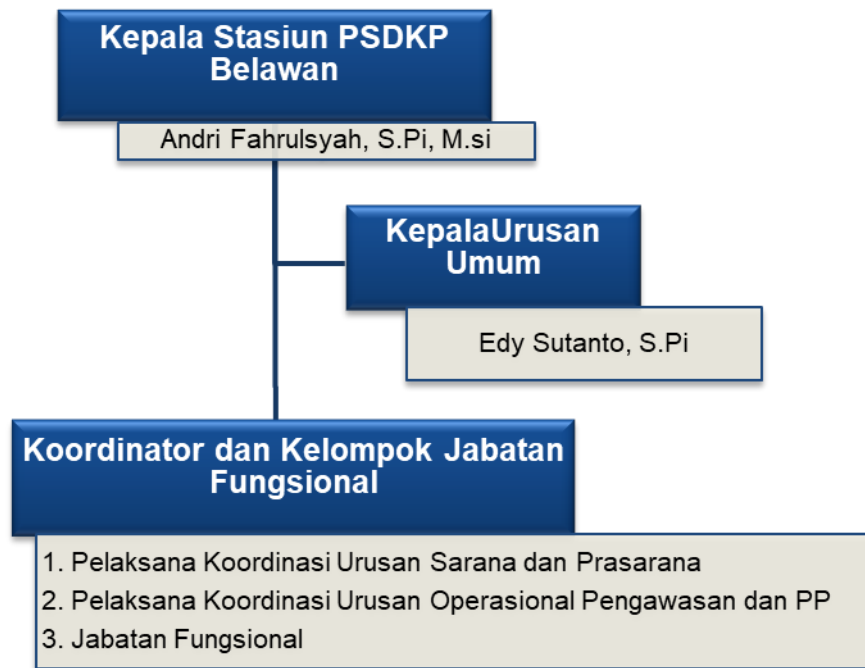
Gambar 1. Struktur Organisasi Stasiun PSDKP Belawan