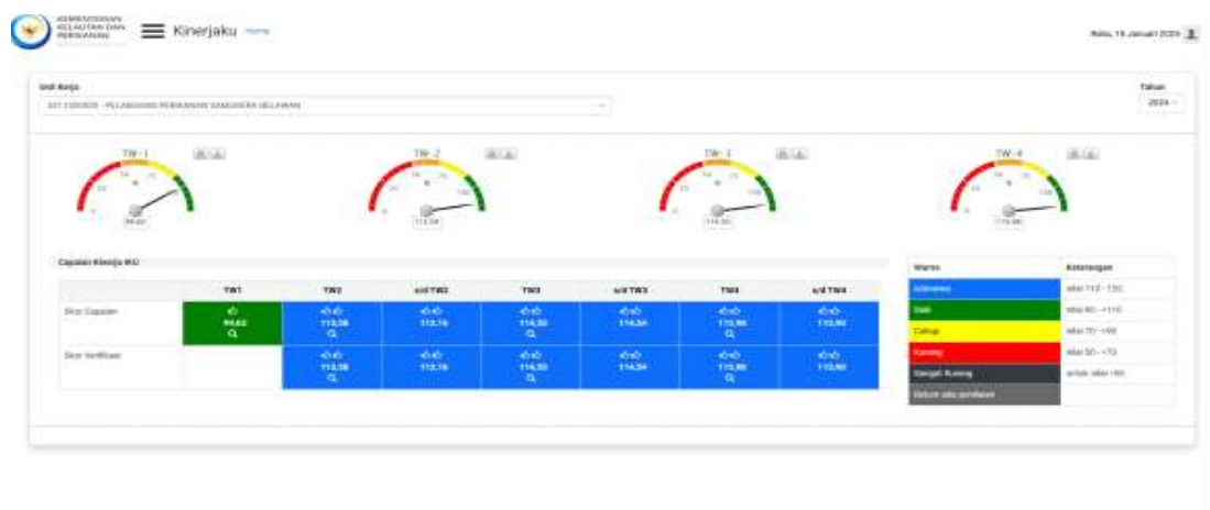
Gambar 3. Dashboard Kinerja PPS Belawan Triwulan IV Tahun 2024 sebagaimana pada aplikasi http://Kinerjaku.kkp.go.id

Pada Triwulan IV tahun 2024, PPS Belawan telah menetapkan 18 (Delapan belas) IK, dimana realisasi sampai dengan Triwulan IV tahun 2024 menunjukkan bahwa sasaran kegiatan telah dapat dicapai dengan rata-rata capaian sebesar 115,90% (Istimewa) (Gambar2). Uraian rincian dari hasil pengukuran capaian kinerja dilaporkan pada bagian selanjutnya bab III.