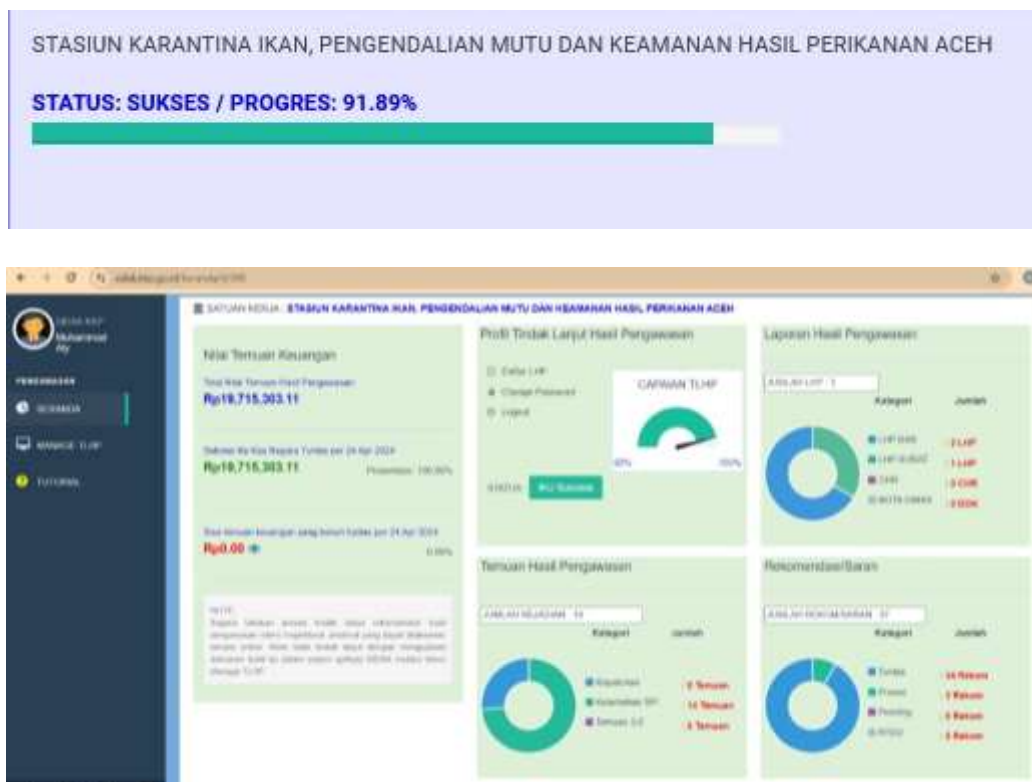
Gambar. 9 Capture Aplikasi Sidak KKP Tahun 2024 Triwulan I