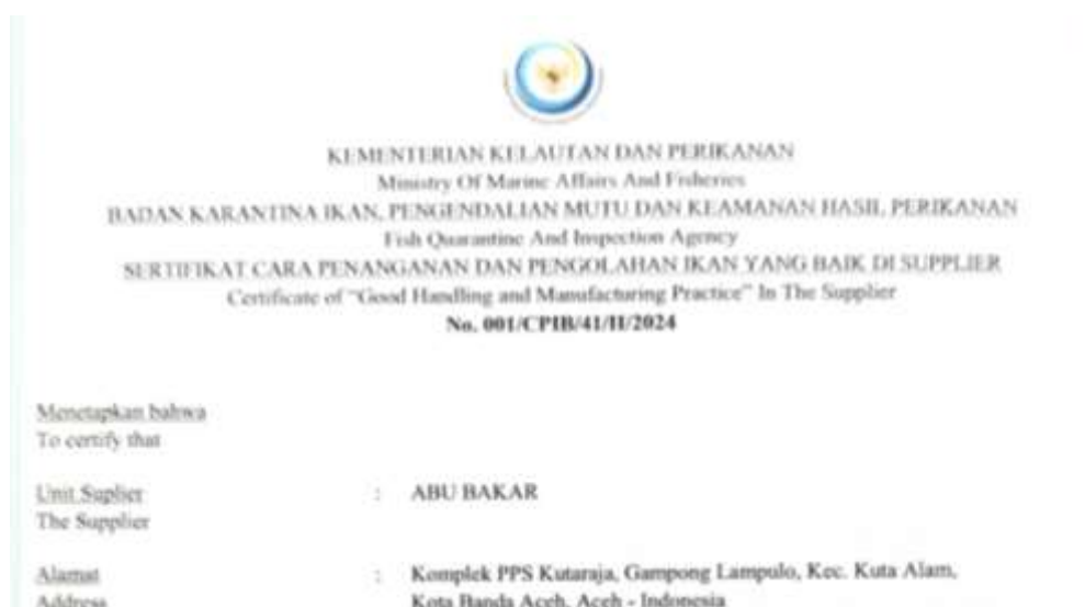
Gambar. 6 Capture Sertifikat CPIB Suplier Tahun 2024 Triwulan I