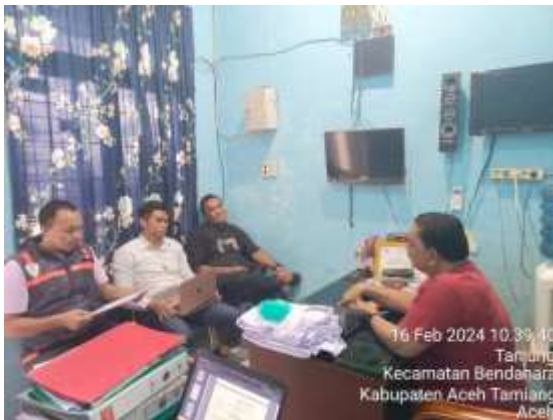
Gambar. 7 Kegiatan Monitoring Penerapan HACCP di UPI Tahun 2024 Triwulan I