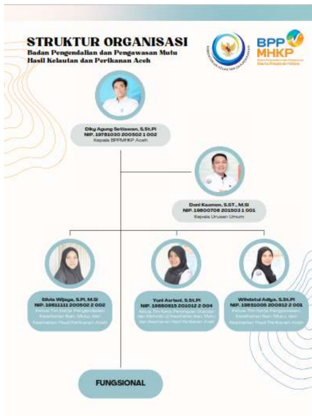
Gambar 1. Struktur Organisasi Tahun 2024

Dalam melaksanakan tugas dan fungsi tersebut, SKIPM Aceh dituntut untuk melaksanakannya dengan transparan, akuntabel, efektif, efisien dan terpercaya sesuai dengan prinsip-prinsip good governance . Salah satu azas penyelenggaraan good governance yang tercantum dalam undang-undang Nomor 28 Tahun 1999 adalah azas akuntabilitas yang menentukan bahwa setiap kegiatan dan hasil akhir dari kegiatan penyelenggara negara harus dapat dipertanggungjawabkan kepada pemangku kepentingan sesuai dengan ketentuan peraturan perundang-undangan yang berlaku. Akuntabilitas tersebut diwujudkan dalam bentuk penyusunan laporan kinerja.