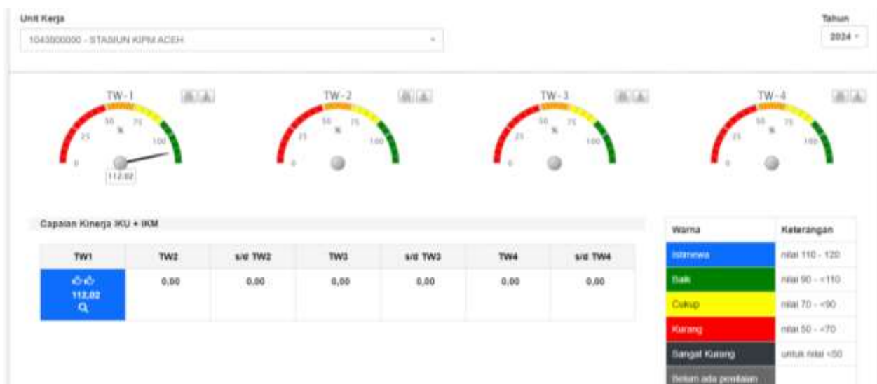
Gambar 4. Tampilan Aplikasi Kinerja Tahun 2024 Triwulan I