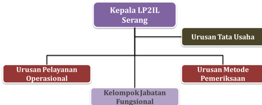
Gambar 1 Perubahan Struktur Organisasi LP2IL Serang Tahun 2021